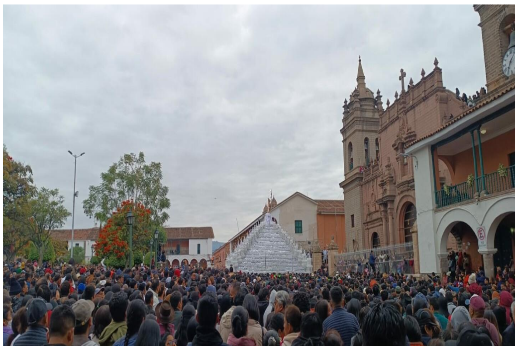
Figura 3: procesión del Señor de Pascua de Resurrección.