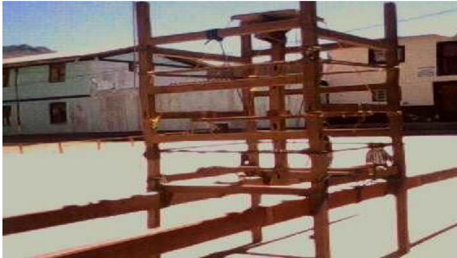
Figura 4: Armado del armazón para el anda.