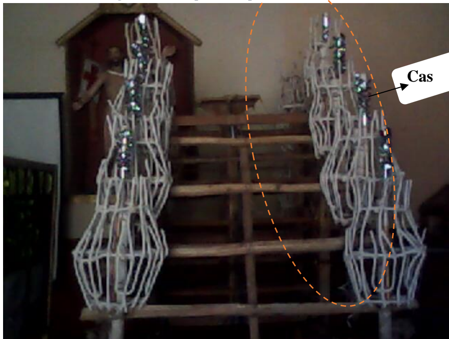
Figura 5: Después de poner los cascos.